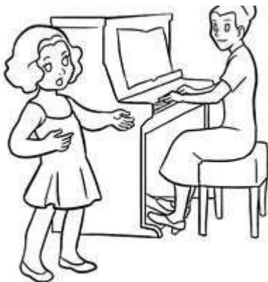
Μάθημα γυμναστικής. Μάθημα μουσικής.