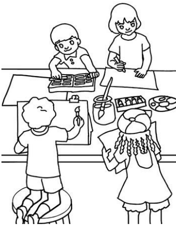
Μάθημα ζωγραφικής. Μάθημα φυσικής.