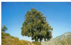
Τουλίπα η κυπρία